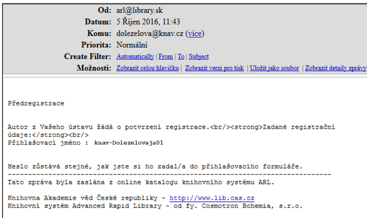
Obr. č. 1. Předregistrace – mail pro zpracovatele

Zpracovatel obdrží mail s informací, že autor vyplnil formulář předregistrace.